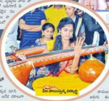
వీణ వాయిస్తున్న విద్యార్థి

అందిస్తుంది. ● మహిళల తర్రతకు ప్రత్యేక పంకరం.. ప్రస్తుతం ఎక్కడ చూసిన మహిళలపై అనేక రకాలుగా