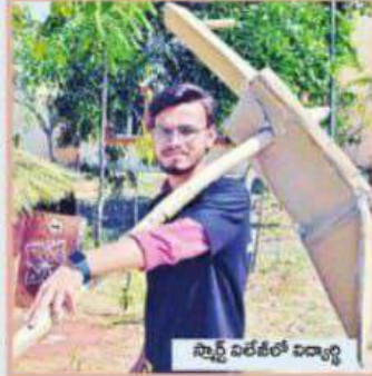
స్ట్రాట్ ఇటీలో విద్యార్థి