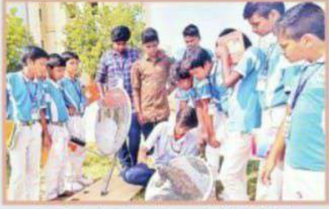
విద్యార్థులకు పలు విషయాలపై అవగాహన కల్పిస్తున్న ధృశ్యం