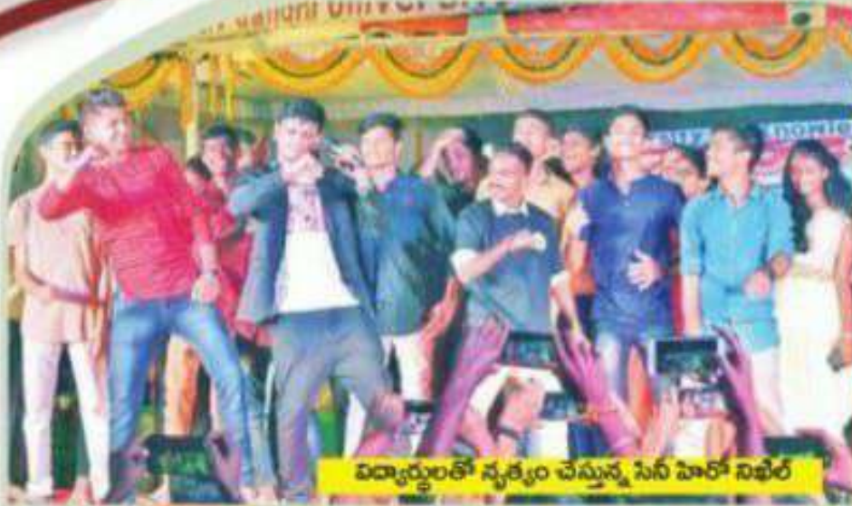
విద్యార్థులతో నృత్యం చేస్తున్న సినీ హీరో నిఖిల్