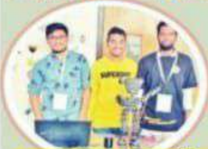
విద్యార్థులు రూపొందించిన రోబో