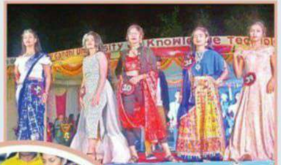
విద్యార్థుల ఫ్యాషన్ షో

అందుకు కోసం ట్రిపురల్ ఇటీ విద్యార్థులు ఒక మొల్లెట్ యాప్ను రూపొందించారు. ఈ ఆప్లికేషన్ వస్తువులను, మనుషులను గుర్తించి వాయిస్ రూపంలో సంచితం అందిస్తుంది. అందుకు, వస్తువులు వారు వాయిస్ రూపంలో అడిగితే తిరిగి వారికి సరైన సమాచారం, సూచనలు వాయిస్ రూపంలో