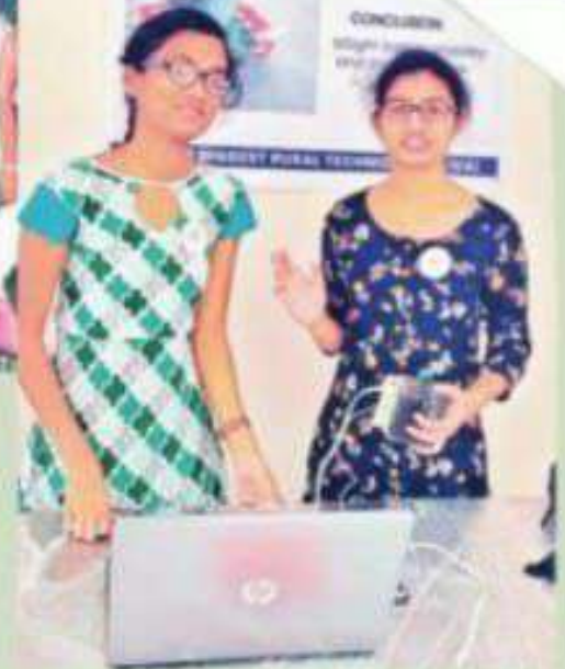
అంధుల కోసం రూపొందించిన యాప్